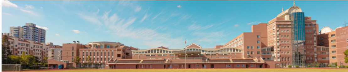
2026年复旦大学附属复兴中学（高中部）自主招生网上报名系统