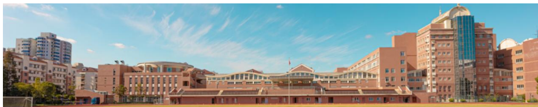
2026年复旦大学附属复兴中学（高中部）自主招生网上报名系统